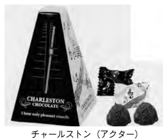
チャールストン (アクター)

芥川製菓(株)は1886(明治19)年創業の老舗チョコレートメーカー。日本のチョコレート史の幕開けとほぼ同時にスタートし、一貫してチョコレート専門メーカーとして歩んできた。 昨年の秋にはテレビ東京の人気番組『出沒! アド街ツク天国』(駒込編)で第9位にランキングされるなど、ご当地メーカーとしての存在感を示した。 バレンタイン商戦の有名デパートや大手量販店、コンビニなどで目につく「ザ