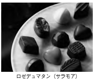
ロゼデュマタン (サラモア)

芥川製菓のブランド 2月3日(日)必着で、ASA西ヶ原宛、ハガキまたはファックスでご応募いただきたい。 応募多数の場合は抽選となり、ASA田端・ASA西ヶ原からの引換券をお届けの引換日の2月10日・11日の両日にASA田端・ASA西ヶ原店頭で引換券と交換にチョコレートをお渡しするという流れとなる。