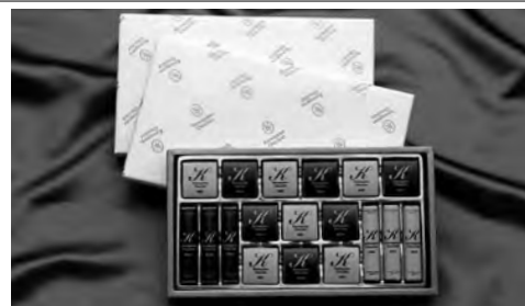
芥川製菓(株)の「駒込ショコラ」 芥川製菓ネットショップ http://www.2.enekoshop.jp/shop/akutagawaseika/ より

3面-4面 shoppin navi. 駒込すずらん鍼灸整骨院/HBカイロプラクティック/駒込デンタルオフィス/東進こども英語塾 駒込教室/オーストラリア セルヴァジーナ/ソシアルダンススクールますぶち/西ヶ原ローズ動物病院/ただだ整骨院・鍼灸マッサージ院/松の湯/いぶき整骨院/憩空間 ぶらの本舗/福八